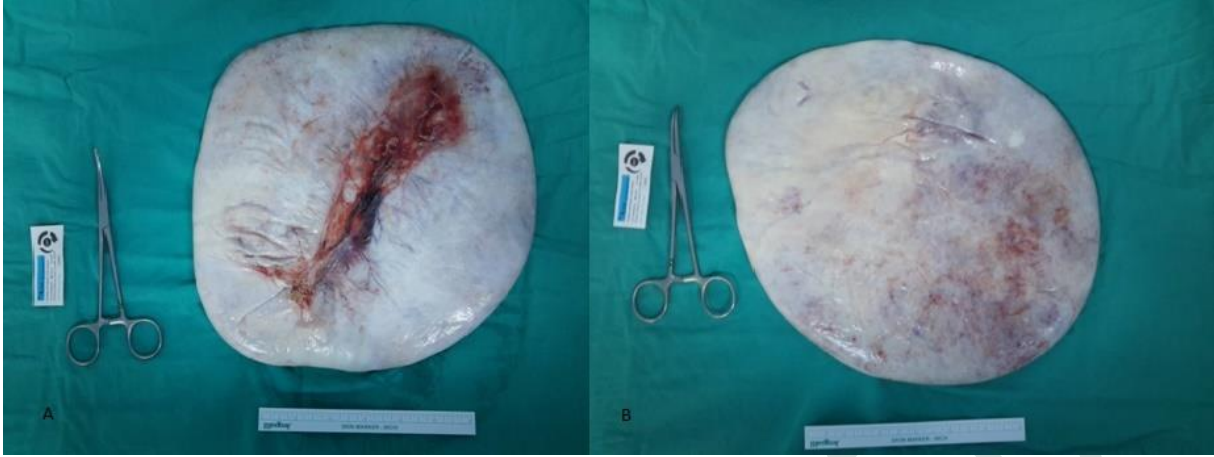
Resim 3. a,b.